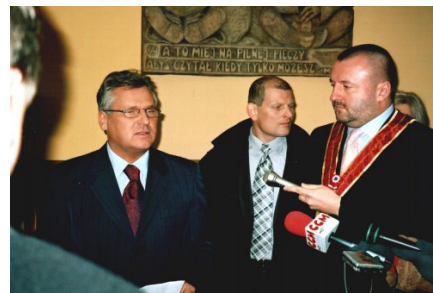
Wypowiedź Prezydenta RP Aleksandra Kwaśniewskiego podczas otwarcia Klubu Biblionetu w Wiśle