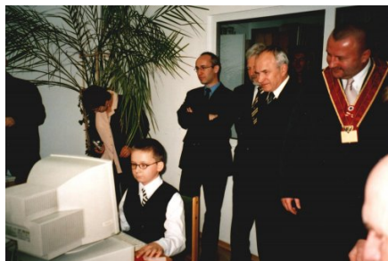
Otwarcie Klubu Biblionetu w Miejsko - Gminnej Bibliotece Publicznej w Węgorzewie