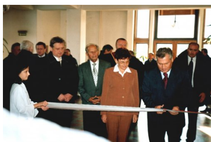
Uroczyste otwarcie Klubu Biblionetu przez Prezydenta RP w Miejskiej Bibliotece w Wiśle