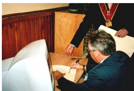
Podpisanie aktu pamiątkowego przez Prezydenta RP